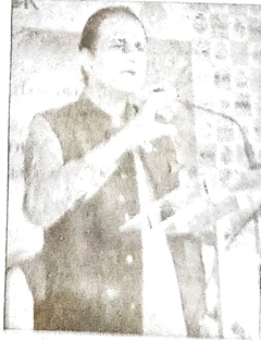
ایف ڈی سی کے ڈائریکٹر جنرل ایف ڈی سی کے ڈائریکٹر جنرل ایف ڈی سی کے ڈائریکٹر جنرل

محکمات شجرکاری کے تحت شجرکاری کے لئے باغ ابن قاسم کو مزید سرسبز بنانے کے لئے شجرکاری کی جائے گی۔