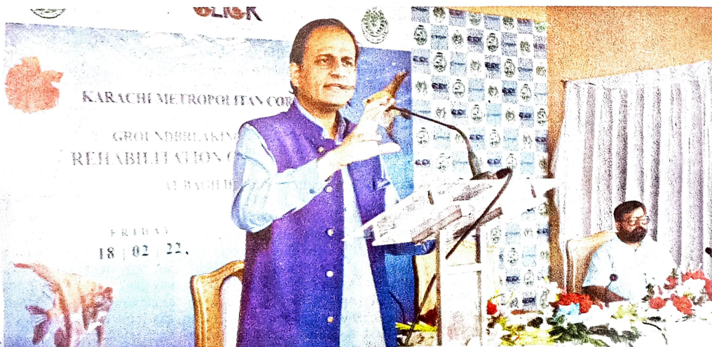
KMC Administrator Murtaza Wahab speaks at the groundbreaking ceremony on Friday for the restoration of the Fish Aquarium in Clifton

"We are trying to reopen all the public places in the city. We will do everything with the help of civil society," he said.